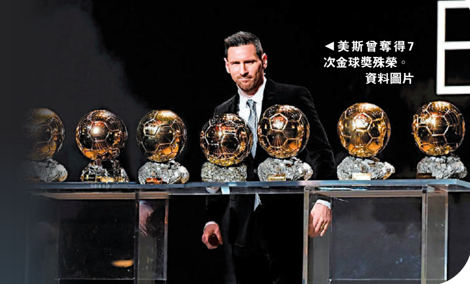
▲美斯曾奪得7次金球獎殊榮。