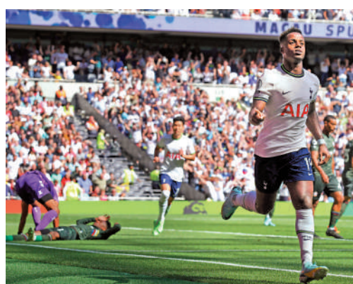
▲熱刺（白衫）上仗反勝修咸頓表現出色。資料圖片

更見困難。熱刺同樣精簡人手，把尼當比利、迪盧斯素、利古朗及哈利雲克斯踢出1隊，但球隊已在