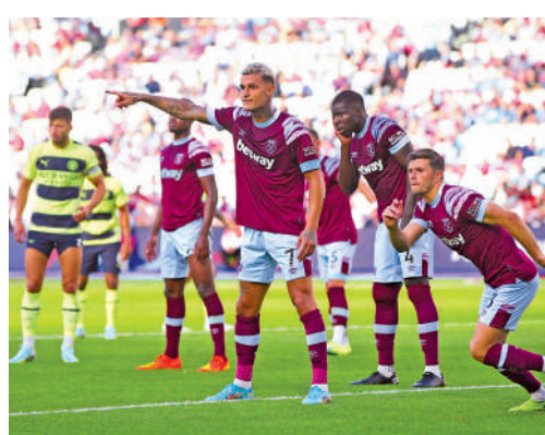
▲韋斯咸（紅衫）上仗不敵強隊曼城。資料圖片

法，今仗難望搶分。韋斯咸首戰輸給曼城，其實防守已算出色，只是「走甩」夏蘭特兩次失掉兩球，包括一記12