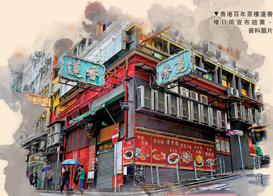
蓮香樓左方屋樑上懸掛了雀籠。