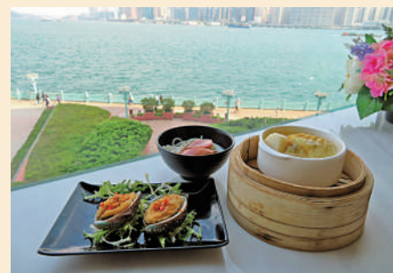
▲飲食業也要隨時代進步，一些中餐廳推出的點心，實相精緻。

起，人們可以選擇的美食也愈來愈多，飲茶習慣也會隨之發生改變，這些都會令茶樓流失客源。專訪尾聲，鄭寶鴻希望公眾可以給予為數不多的傳統茶樓以更多關注。畢竟，一家老字號茶樓的消失，最失落的莫過於一眾飲茶客。