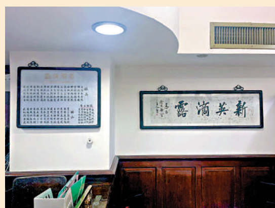
▲陸羽茶室二樓的陳設。

記者還看到鄰桌有外國人的身影，看來陸羽茶室也征服了外國人的胃。只見兩位食客選好了茶，一邊吃着點心，一邊用英語聊着近況，很是放鬆。不遠處，一早來吃早茶的一家四口仍在享受着美食。正值午市，不少年輕食客陸續進入二樓，耳邊傳來陣陣廣東話聲浪。一位年輕食客走進二樓大堂，被「茶博士」告知位置已滿，只有在一點半之後才會有空位。上班的日子，陸羽