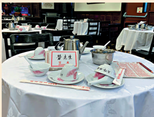
▲二樓不少餐枱早已被食客預訂。