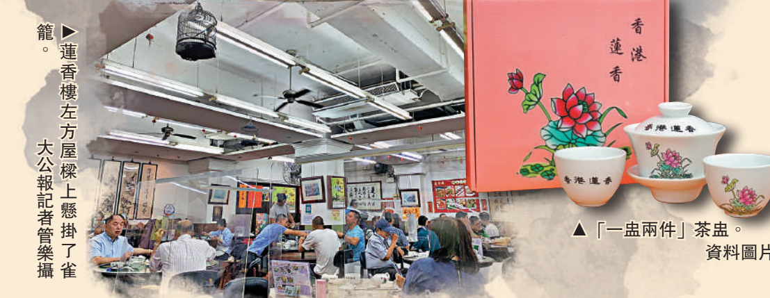
▲「一盅兩件」茶盅。