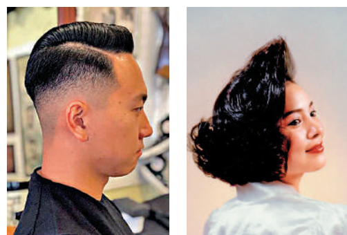
21世紀初至今：昔日流行 復古重現

▲港台流行文化風行內地，四聯理髮師傅也消化了由演藝明星帶火的各式潮流髮型，如「蘑菇頭」、「爆炸頭」。