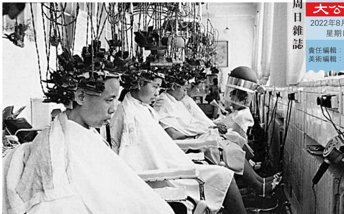
改革開放後-80年代：重整旗鼓 率先試水 ▲「文革」結束後，四聯逐漸恢復營業，並成為改革開放之初特許進行燙髮服務的幾個理髮店之一。