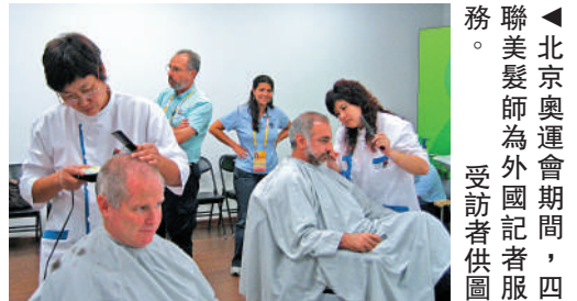
▲北京奧運會期間，四聯美髮師為外國記者服務。

記者們提供美髮服務。「當時我在MPC（奧運會主新聞中心）給外國記者服務時，有一個外國女記者，說要