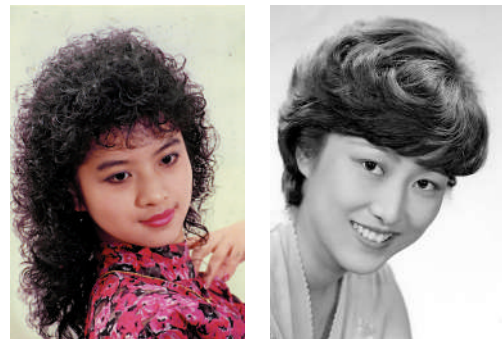
80年代中後期開始：港台時髦 消化吸收

▲港台流行文化風行內地，四聯理髮師傅也消化了由演藝明星帶火的各式潮流髮型，如「蘑菇頭」、「爆炸頭」。