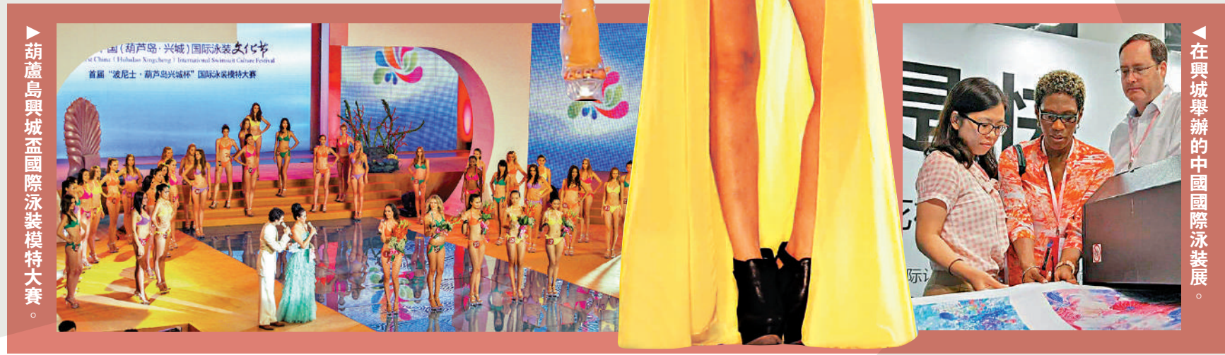
葫蘆島興城盃國際泳裝模特大賽。

數據顯示，截至2021年底，興城地區泳裝企業共登記市場主體4828戶，年均產量1.7億件套，從業人員6萬餘人，銷售收入逾百億元，佔內地市場份額近40%。