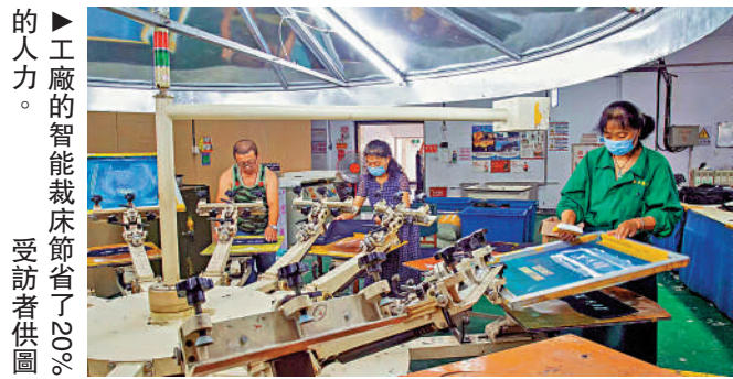
工廠的智能裁床節省了20%的人力。

正忙著直播帶貨，她的直播間每日銷售額可達20萬元以上。借助「笑姐」的直播帶貨，興城市瑞祥製衣廠成為去年以來當地崛起最快的泳裝「新勢力」，年銷售額達到數千萬元。目前，興城地區泳裝電商出貨量的六成以上都來自葫蘆島電商直播基地的直播帶貨，在這裏，平均每天有157家興城地區泳裝企業進行直播，今年6月份直播銷售額達到5300萬元。