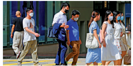
63.7%受訪者認為透過持續進修可獲得更多向上流動機會。

團體建議，特區政府在新形勢下重新思考與市場的關係，調整其在經濟分配上的職能，讓市民感受到經濟發展帶來的好處。同時應改革持續進修基金，鼓勵青年人透過持續進修培養適合市場需求的專業資格。