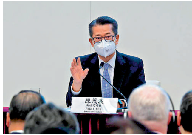
陳茂波表示，暫緩追租期間政府為個人業主提供的零息貸款計劃，僅收到三宗申請。

【大公報訊】政府今年初在《財政預算案》提出的暫緩追租條例，於5月初開始實施，三個月的「保護期」剛於上月底結束。財政司司長陳茂波昨日發表網誌表示，暫緩追租措施並未導致大量小業主無法如期向銀行償還按揭貸款，該措施並促成部分商戶成功與業主達成重構租約或調整租金協議，得以繼續經營。他強調，考慮到暫緩追租保護期結束，將盡可能為面對短暫周轉困難的商戶提供協助。