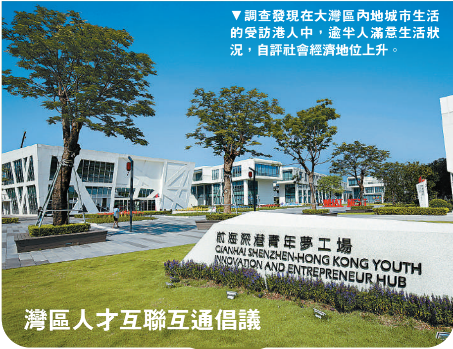
調查發現在大灣區內地城市生活的受訪港人中，逾半人滿意生活狀況，自評社會經濟地位上升。