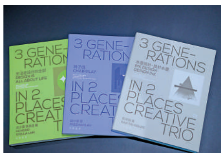
▲《兩地三代 創意三重奏》由中華書局(香港)出版，呈現三代設計師以各自的方式打破界限、拓展中國文化和現代設計的發展空間。