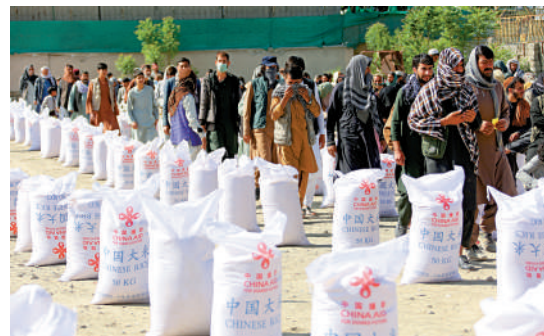
▲4月23日，阿富汗民眾在喀布爾領取中國援助的糧食。

的中國援助。他告訴記者：「當我幾個月前第一次扛着中國援助的大米回家的時候，孩子們都高興極了。」居住在阿富汗西部赫拉特省貧民