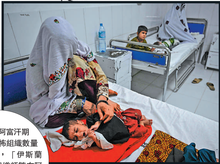
▲阿富汗遭遇糧荒，很多兒童因營養不良入院。

美國入侵阿富汗期間，當地恐怖組織數量激增。如今，「伊斯蘭國」等恐怖組織頻繁在阿境內製造襲擊事件，阿民眾深受其害。