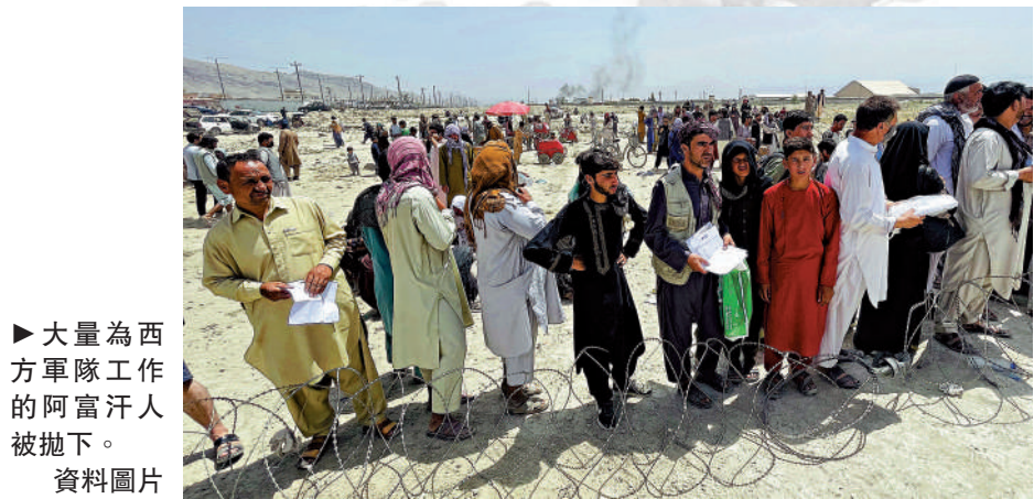
►大量為西方軍隊工作的阿富汗人被拋下。 資料圖片