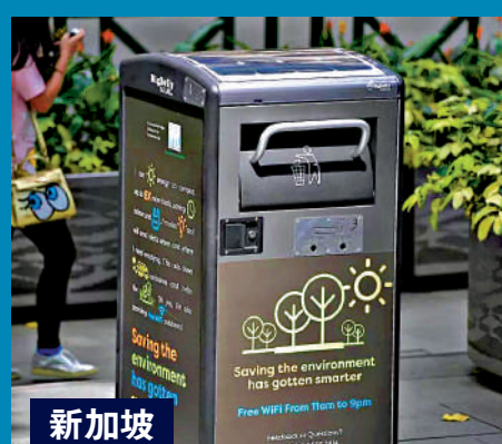
▲新加坡的高科技垃圾筒。