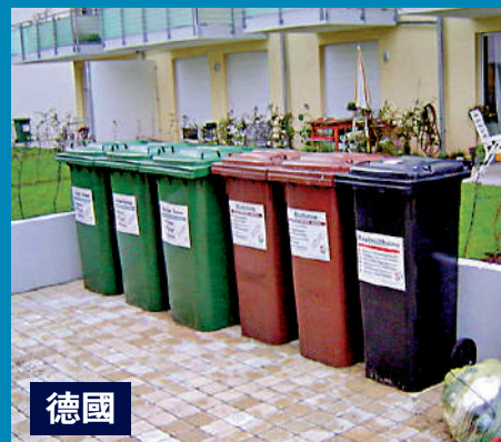
▲德國按垃圾桶大小、處理次數等徵收處理費。

新加坡則借助高科技處理垃圾問題。新加坡採取劃一的垃圾徵費，不論垃圾量多少，每戶每月徵費都是8.25坡元(約47.4港元)。同時國家又開始試行新的垃圾徵費制度，在垃圾桶上應用無線射頻識別(RFID)技術，記錄住戶打開垃圾桶的次數，同時每次打開亦只會接收特定容量垃圾。