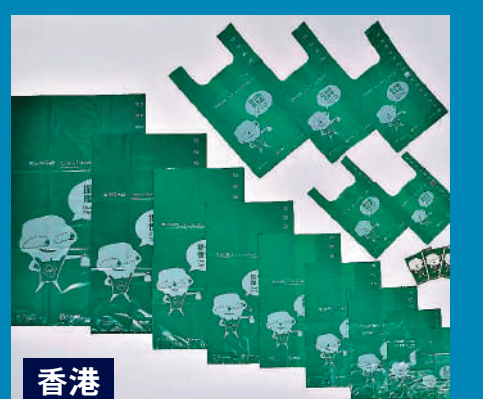
▲香港明年將實施垃圾徵費。