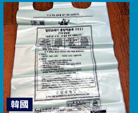
▲韓國早期是按垃圾袋數量徵費。