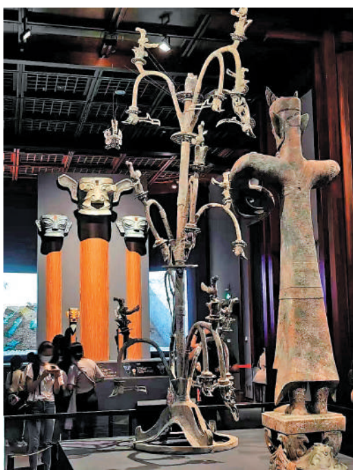
▲展覽現場模擬的祭祀場景。