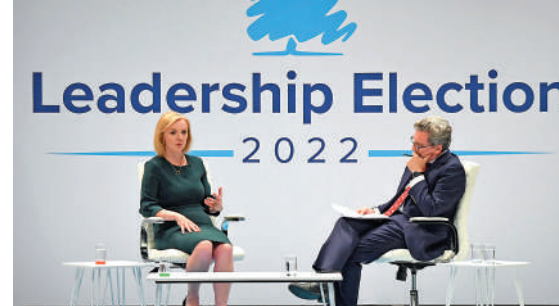
▲特拉斯（左）16日出席保守黨活動。

上一項民調顯示，特拉斯的黨內支持率領先對手、前財政大臣蘇納克22%，新黨魁將於9月5日出爐。