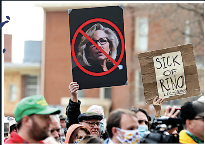
▲去年國會暴亂後，特朗普的支持者在懷俄明州舉行反切尼集會。