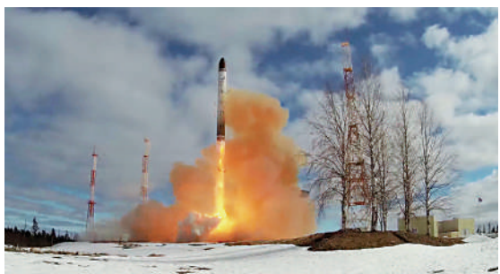
▲俄軍4月20日成功試射「薩爾馬特」洲際彈道導彈。

分析指，土耳其的態度延緩了俄烏戰爭以來其在西方和俄羅斯之間保持平衡的做法。土耳其總統埃爾多安本月初與普京會面後，將於周四前往烏克蘭與聯合國秘書長古特雷斯和烏總統澤連斯基舉行三方會談。