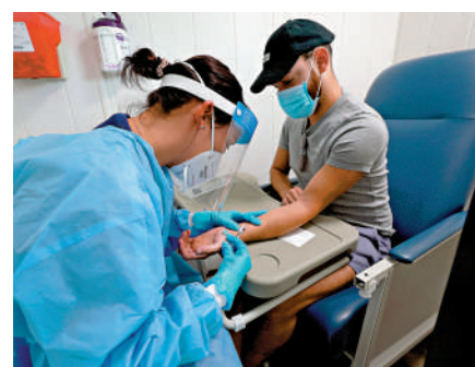
▲全球唯一的猴痘疫苗生產商警告其產能不足。

《刺針》的報告指出，這隻寵物犬與這對男男同性伴侶同床，牠在舔舐其中一人後，又舔舐了自己的身體，因此感染猴痘病毒。醫生檢查發現，寵物犬的皮膚和黏膜有損傷，腹部有膿包，肛門有潰瘍。醫務人員將同性伴侶中一人的病毒樣本與動物身上的病毒樣本進