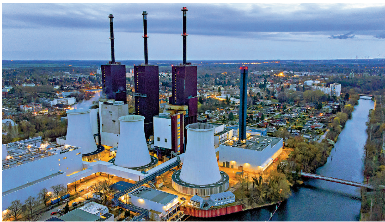
▲德國能源短缺引發民生危機，圖為德國的燃氣發電廠。

【大公報訊】綜合《華爾街日報》、《華盛頓郵報》、BBC報導：美媒16日援引德國官員的話，稱當局已經決定推遲關閉僅存的三座核電站，讓它們在今年年底後繼續運營。德國經濟部發言人稱當局仍在考慮中，尚未作出決定。民調顯示，70%德國民眾支持保留核電站，唯恐要在寒冷冬季飽受能源短缺之苦。