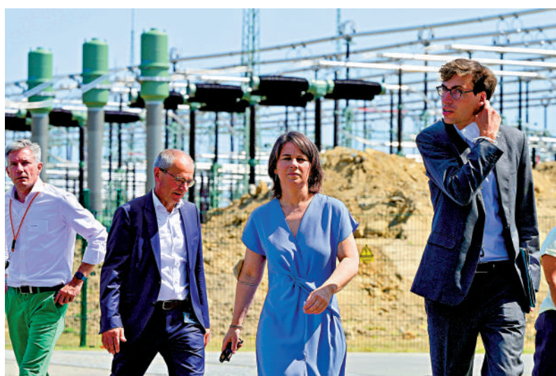
◀德國外長貝爾博克（右二）參觀柏林附近的電力中繼站。