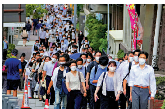
▲日本第七波疫情來勢洶湧，東京市民早高峰戴口罩出行。

手足口病是由腸道病毒引起的傳染病，病症為手、足、口處發疹，幼兒病患居多。多數患兒一周左右自愈，少數