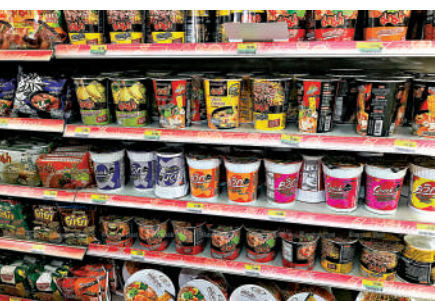
▲泰國即食麵製造商抱怨虧本，14年來首次要求漲價。

泰國5家主要的即食麵製造商Mama、Sue Sat、Wai Wai、Yam Yam和Nissin，周一連署向泰國政府要求調漲即食麵售價，希望從6泰銖（約1.33港元）調高到8泰銖（約1.77港元），這是自2008年以來的首次調漲。