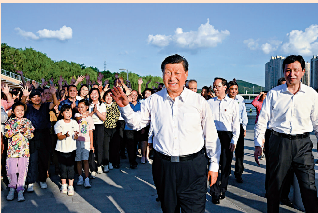
▲8月16日下午，中共中央總書記、國家主席、中央軍委主席習近平在遼寧省錦州市東湖森林公園考察。這是習近平向市民揮手致意。

【大公報訊】綜合新華社、央視新聞報道：16日下午，中共中央總書記、國家主席、中央軍委主席習近平在遼寧省錦州市先後考察了遼瀋戰役紀念館、東湖森林公園。在東湖森林公園調研時，習近平正在休閒娛樂的市民親切交流。習近平指出，中國式現代化是全體人民共同富裕的現代化，不只是少數人富裕，而是要全體人民共同富裕，皆大歡喜。黨的十八大以來，黨中央實施深入推進東北振興戰略，要繼續搞好，加快產業結構調整，適應新時代改革發展要求，我們對東北振興充滿信心。