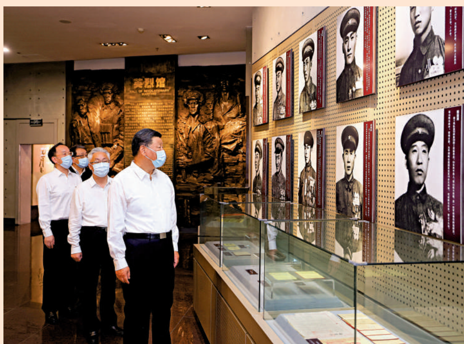
▲16日下午，習近平在遼寧省錦州市考察遼瀋戰役紀念館。