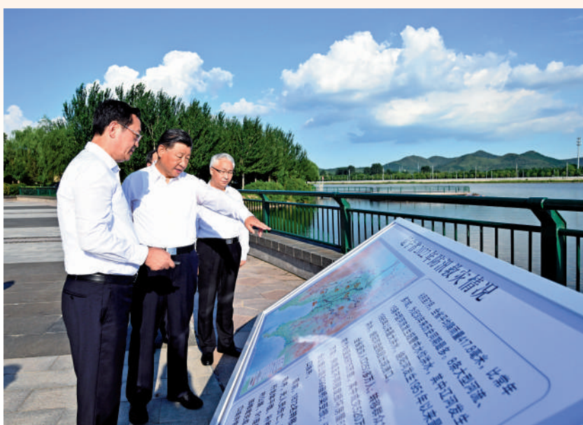
▲16日下午，習近平在遼寧省錦州市東湖森林公園考察。

環境是東北地區經濟社會發展的寶貴資源，也是振興東北的一個優勢。歷次赴東北考察，總書記多次強調生態保護和綠色發展。這次在東湖森林公園，總書記考察小凌河和女兒河環境綜合整治情況。在同當地市民親切交流時，他談到了更為宏闊的主題。總書記指出，中國式現代化是全體人民共同富裕的現代化，不只是少數人富裕，而是要全體人民共同富裕、皆大歡喜。