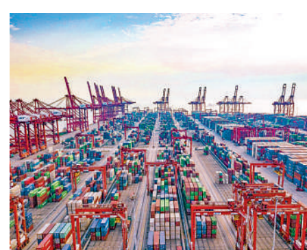
▲位於深圳的蛇口碼頭。

總噸和1個22.5萬總噸郵輪泊位。航站樓6萬平方米，碼頭年通關能力達75萬人次，是亞洲最大、功能最全的郵輪綜合體。