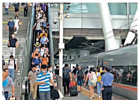
▲廣州南站迎來暑運客流高峰。

廣州南站還常態化做好疫情防護，在出站層以及西門三號售票廳設有3個「免費核酸檢測點」，重點對途經中高风险地区或14天內有本土疫情地區到達的旅客進行核酸檢測；在進出站通道設置37台免費口罩機，最大程度降低病毒通過鐵路傳播風險。