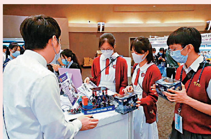
本月初在九龍灣展覽中心舉办的「『童擁AI』CODING∞作品展」。資料圖片

參展作品不少既有一定創科含量,又注重實用性。例如由鐘聲學校四名小同學創作的「智能消毒門檔」,是因應家居防疫需要而製作,該裝置透過micro:bit微型電腦的聲波感應器插件啟動消毒程序,噴灑消毒液於門口地氈上,再開啟門檔讓訪客進入家中。五旬節聖潔會永光書院四位同學的作品「旭」,是一個太陽能發電板搭載系統,由四組液壓裝置組成,可自行調節不同傾角,透過收集日出、日中天及日落等相關數據,計算出太陽所在位置,調整液壓裝置傾角,保持陽光直接照射