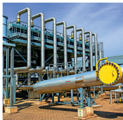
▲立陶宛通脹率居歐盟之首，能源危機是主要原因，圖為立陶宛境內的天然氣站。

【大公報訊】據《華爾街日報》報導：歐盟統計局18日發布最新經濟數據，整體7月通脹率為9.8%，創1997年發布數據以來新高。其中法國和馬耳他6.8%，是所有成員國中最低；前三高的國家為立陶宛20.9%、拉脫維亞21.3%和愛沙尼亞23.2%。分析指，歐盟通脹率居高不下下的關鍵是能源危機導致的價格高漲。