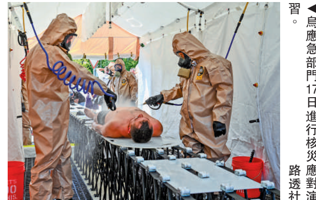
▲烏應急部門17日進行核災應對演習。