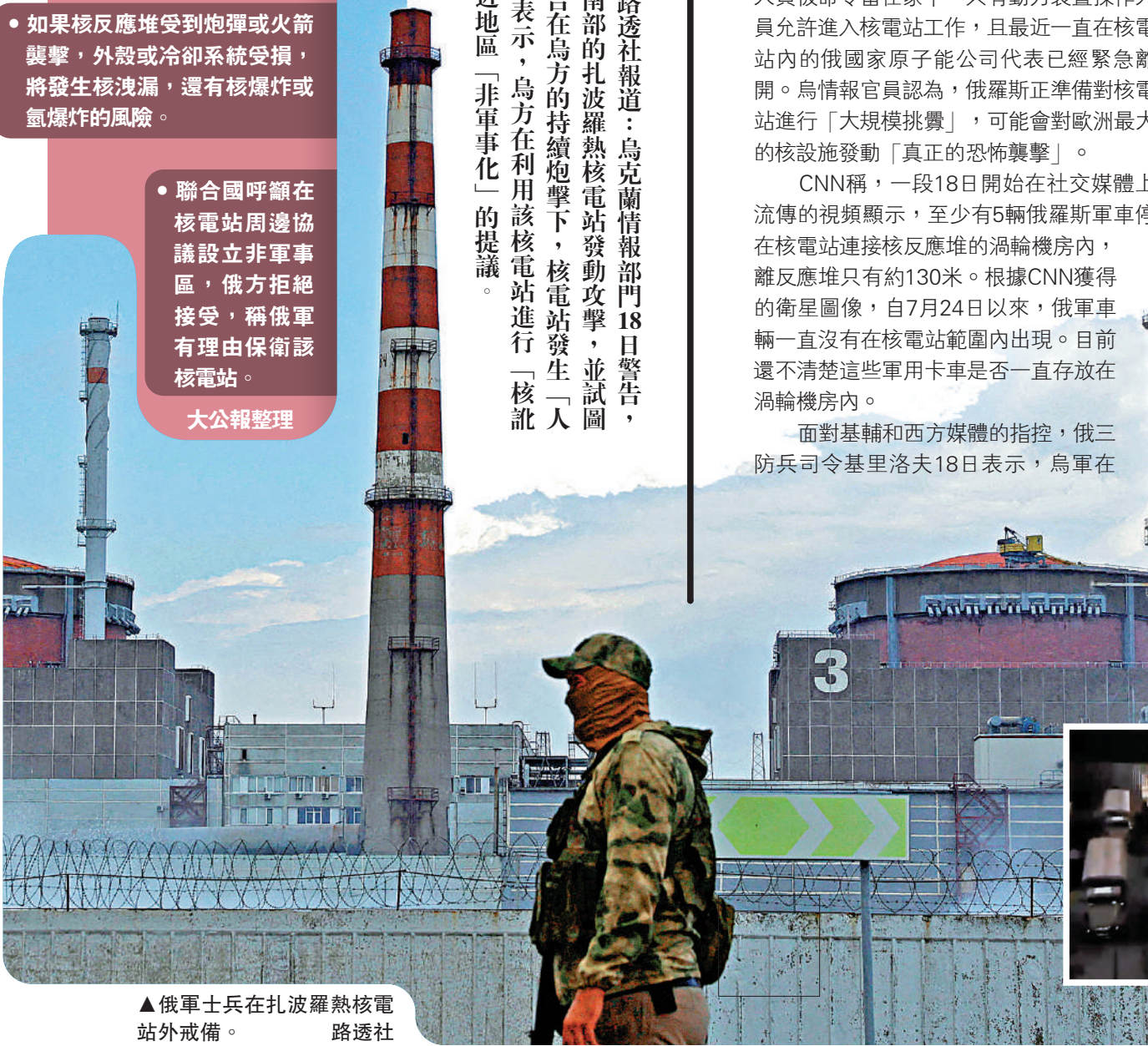
▲俄軍士兵在扎波羅熱核電站外戒備。

除了扎波羅熱核電站，克里米亞大橋也除了為外界關注焦點。烏總統顧問波多利亞克17日呼籲「拆除」該橋樑。克里米亞大橋附近18日晚傳出爆炸聲，附近的刻赤市已啟動防空系統。俄聯邦安全會議副主席梅德韋傑夫早前警告，如果烏軍攻擊克里米亞大橋，「審判日將非常迅速且猛烈地到來」。