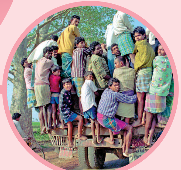
▶印度加爾各答居民擠在嚴重超載的車上出行。