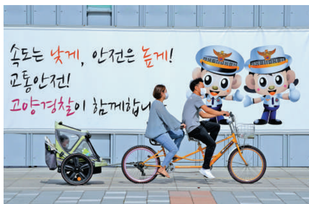
▲許多韓國人不生育是因為沒時間照料，圖為夫婦騎車帶孩子玩耍。

【大公報訊】綜合韓聯社、日本經濟新聞、彭博社報道：韓國統計廳近期數據顯示，截至2021年11月1日，包括在韓國居住的外國人在內，韓國總人口為5173.8萬人，比前一年減少9.1萬人，這是韓國自1949年以來首次出現人口負增長。為了鼓勵生育，韓國各地政府除了現金獎勵，首爾18日還啟動「幸福父母計劃」。2023年起，協助照顧嬰幼兒的近親親屬，每月將獲得政府派發的30萬韓圓（約1797港元）照顧津貼，時間最長一年。