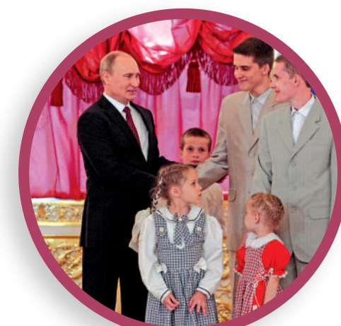
▼俄羅斯總統普京（左）給人口多的家庭頒獎。