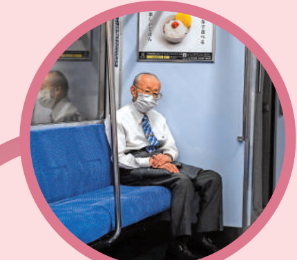
▲日本老齡化嚴重，地鐵上經常見到職員打扮的白髮長者。

在人手短缺的情況下，需要提高生產效率，而日本推動生產效率提高的勞動市場改革幾乎還沒着手進行。社會保障制度、養老金制度的改革也推遲緩慢，青壯年支撐長者醫療護理的負擔越來越重，而想要在職場自食其力的長者，卻面臨年齡歧視。絲毫看不到執政黨有意願解決這些問題。