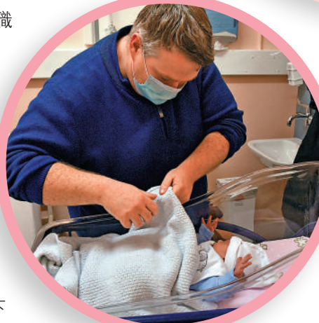
◀多國規定父親也要休產假，幫助照顧幼兒。