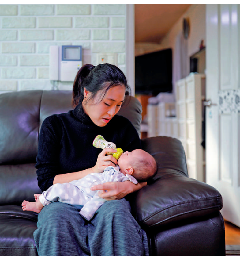
▲韓國生育率全球最低，圖為首爾一位母親給孩子餵奶。