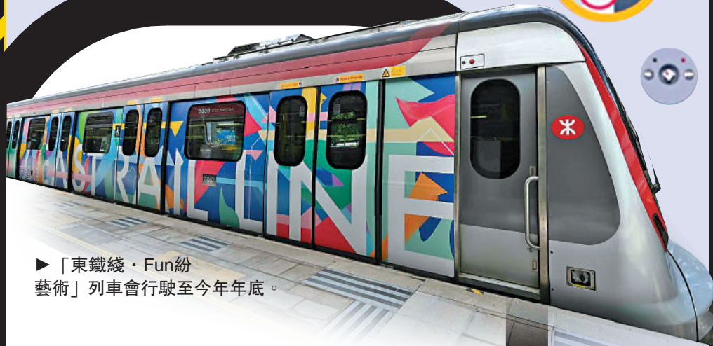
►「東鐵綫·Fun紛藝術」列車會行駛至今年年底。

粉嶺是香港宗教建築最豐富的地區之一，因此畫面上既有寺廟與香火，也有崇謙堂這樣的基督教教堂。畫面左下角的聯和墟舊街市為二戰之後新界北區的第一個墟市。