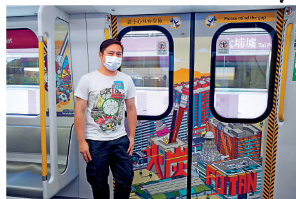
▲插畫師鄭健業將沿綫社區特色融入創作之中。

自本月起，在東鐵綫月台等車，乘客將有機會遇見車身整體色調為淺藍色，上印有各種中文筆畫和繽紛圖案的「東鐵綫·Fun紛藝術」列車。這件以列車為載體的藝術作品內外總面積超過九百平方米，超過兩個標準籃球場。列車第一卡及第九卡均印有「East Rail Line 東鐵綫」大型字體及在車頭印上「東鐵綫·Fun紛藝術」，車身由香港藝術家及插畫師黃鼎豐設計，其靈感源自港鐵路綫圖中東鐵綫的淺藍色、東鐵綫十六個車站顏色以及中文站名筆畫。