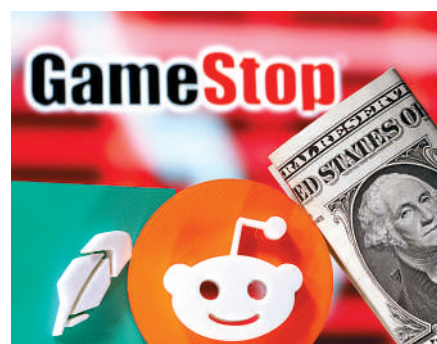
▲美國老牌遊戲零售商遊戲驛站GameStop。

另外，去年1月「散戶大戰華爾街」期間，羅賓漢一度暫時禁止客戶購買GameStop和AMC等熱門股票，被批評如同「拔掉交易網線」，跟華爾街站在一起，引發散戶們對其的集體訴訟。去年6月30日，羅賓漢已吃到了美國金融行業監管局（FINRA）開出的7000萬美元創紀錄罰單，罰款理由是羅賓漢存在「系統性監管失誤」，使數百萬投資者遭到重大損失。今年8月2日，羅賓漢的加密貨幣部門被紐約州監管部門罰款3000萬美元，原因是監管反洗錢和保護網絡安全不力。邁阿密地方法院法官在8月11日裁定，GameStop、AMC的投資者，可繼續對羅賓漢提起集體訴訟，指控羅賓漢實施交易限制措施人為壓低了股價。