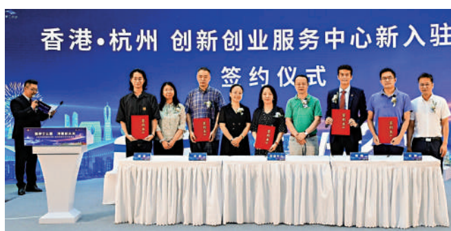
香港·杭州 创新创业服务中心新入驻 签约仪式