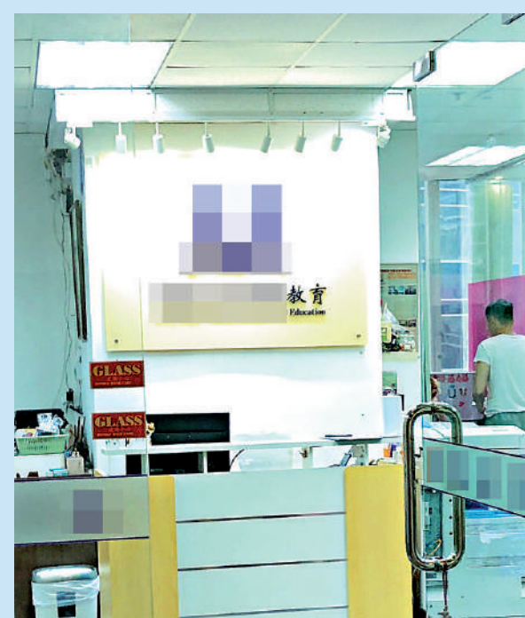
熹×公寓的地址位於觀塘創富中心，大公報記者到訪發現上址正被一家教育諮詢公司租用，職員表示若學生想租樓可幫忙轉介。