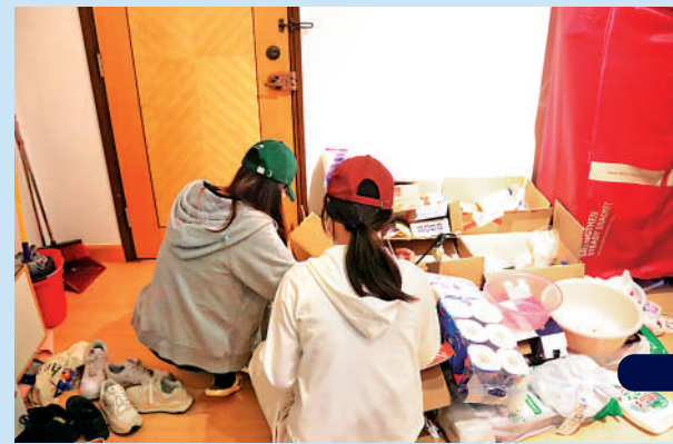
多名租用港漂家學生宿舍的學生，今年3月起被業主以港漂家欠租為由要求搬走。