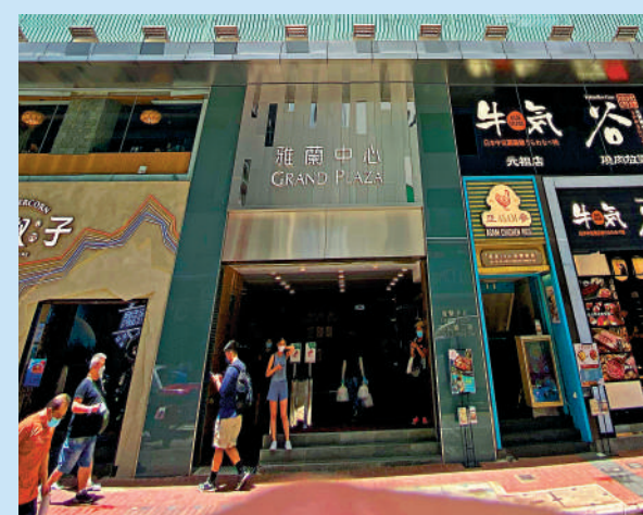
熹×公寓客服所說的辦公地址位於雅蘭中心2期10樓，但上址並未掛有該公司招牌。