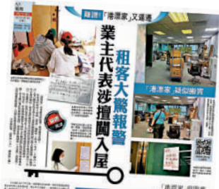
《大公報》今年上半年多次以系列報道，跟進港漂家逼遷事件的最新發展。