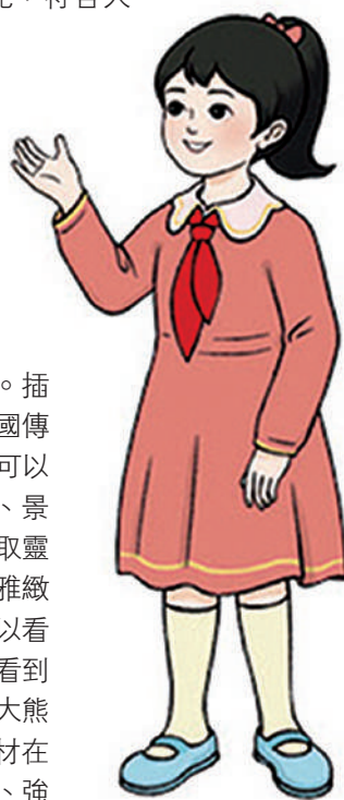
▲新版教科書展示的低年級人物造型。

教材的氣韻。新插圖還體現出濃厚的中國文化氣息。插圖用色參考中國傳統色彩，插圖內容包含中國傳統文化習俗、中國特色建築等。翻閱教材，可以看到新插圖呈現全新的色彩風格，在服裝、景物、靜物等的用色上，從中國傳統色彩中汲取靈感，並結合新時代藝術特點，形成較為明快雅緻的色彩風格。就插圖具體內容來說，我們可以看到胡同、園林，可以看到剪紙、雜技，可以看到算盤、圍棋、太極拳，還有不少憨態可掬的大熊貓……通過富有中國文化氣息的插圖，教材在構建更貼合生活的情境的同時，擴充、滲透、強化中國傳統文化知識，拓寬學生的視野，讓學生更好地理解 and 傳承中華優秀傳統文化。 新華網