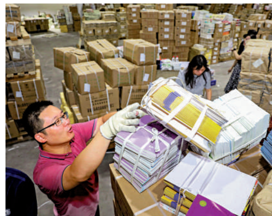
▲8月17日，江蘇淮安新華書店工作人員在搬運新學期教材。 新華社

此外，針對社會通過專門郵箱反映的教材問題，教育部建立24小時處置機制，由專人分時段及時查收郵件，逐一對郵件進行分類登記，實行台賬管理。截至8月21日，共收到反映教材問題的郵件1780封，組織專門力量對郵件進行分析研判，分類反饋有關出版單位和責任部門研究處理。