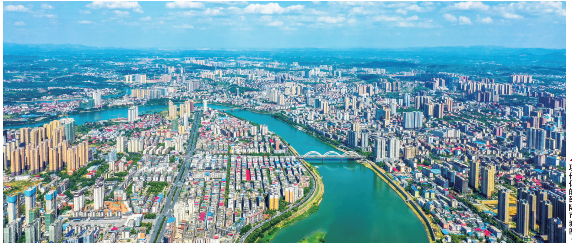
現代化的邵陽市城區。