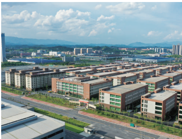
▲邵陽東盟科技產業園。