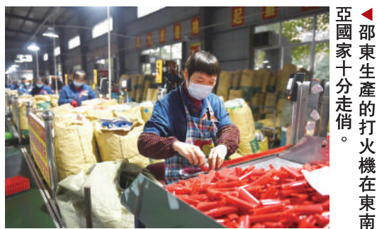
▲邵東生產的打火機在東南亞國家十分走俏。邵陽經濟技術開發區。

「我們通過精益化、自動化、信息化、智能化的系統構建與整合，可達到人員節省40%，效率提高2至3倍。」在拓浦精工車間，一位負責人說。目前，該公司單條智能電飯煲生產線日產量達2,000台。