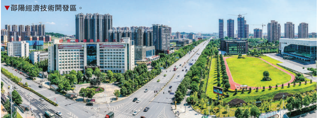
▲邵陽經濟技術開發區。