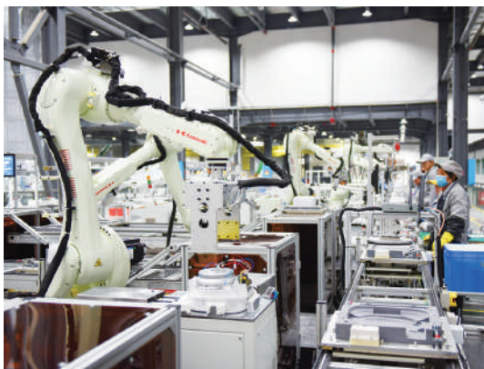
▲拓浦精工智能化生產車間。73%以上的GDP、75%以上的稅收、80%以上的就業和90%以上的市場主體。

邵陽是全國民營經濟重要發祥地，邵商多達百萬，資產超4萬億。隨著湘南湘西承接產業轉移示範區建設、新時代推進湘西地區開發形成的新格局，邵陽開放合作的平台更加寬廣、底氣更充足、吸引力更強大。