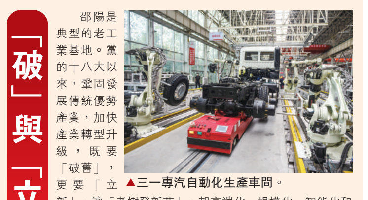
▲三一專汽自動化生產車間。邵陽是典型的老工業基地。黨的十八大以來，鞏固發展傳統優勢產業，加快產業轉型升級，既要「破舊」，更要「立新」，讓「老樹發新芽」，朝高端化、規模化、智能化和國際化邁進。

邵陽維克液壓股份有限公司由國營邵陽液壓件廠改制而來，堅持技術創新，多項技術打破國外壟斷，成為中國液壓行業替代進口設備的專業戶。2021年，「邵陽液壓」在創業板上市，實現邵陽市上市企業零突破。