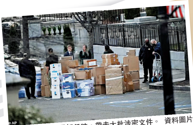
▲特朗普去年1月卸任時，帶走大批涉密文件。資料圖片