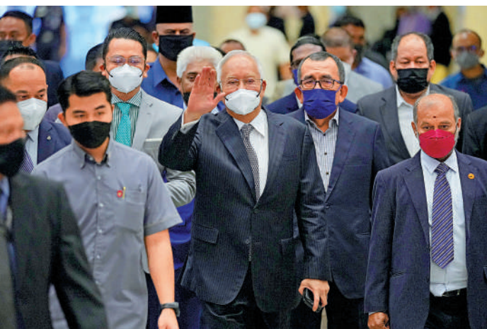
▲馬來西亞前總理納吉布(中)23日抵達法院。