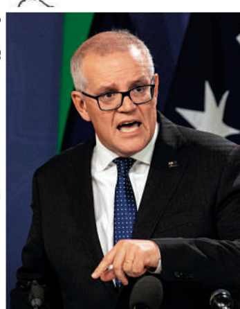
▲澳洲前總理莫里森17日在悉尼見記者。路透社

【大公報訊】綜合美聯社、《金融時報》報導：澳洲前總理莫里森在疫期間秘密兼任五個部長職位一事引發軒然大波，有評論直斥澳洲民主制度已淪為笑柄。總理阿爾巴內塞23日表示，司法部調查報告顯示，莫里森的行為沒有違法，但破壞了「我們的議會民主制」。有學者表示，莫里森的行為已經讓澳洲陷入一場「小型憲政危機」，誤導了議會和公眾，「如果他是一名普通員工，早就被炒掉了」。