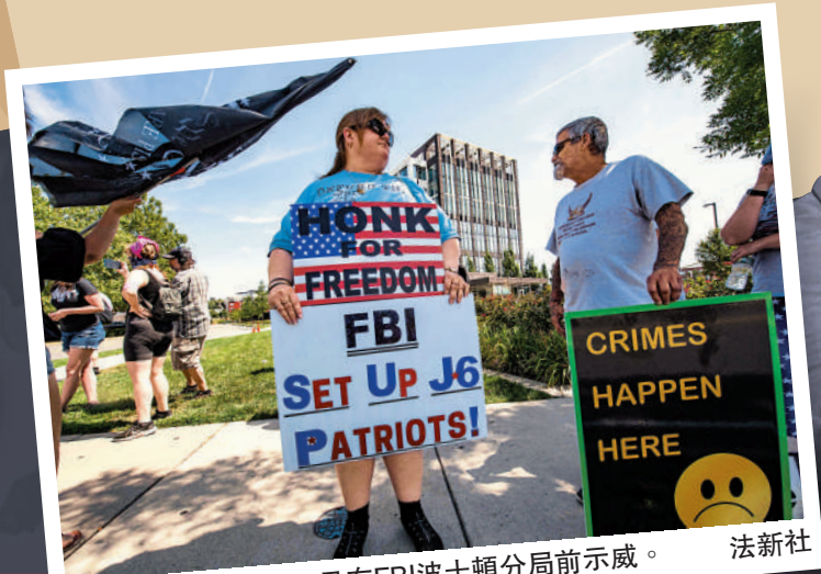
▲特朗普的支持者21日在FBI波士頓分局示威。