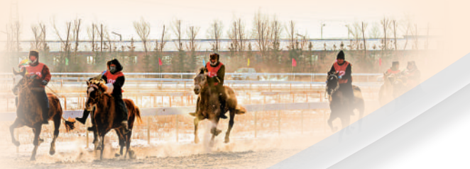
鄂溫克族的傳統活動，在-30℃的極寒天氣中開展。

使鹿部落鄂溫克族人世代生存於大興安嶺，那裏冬季漫長而寒冷，最低氣溫可達零下50攝氏度以下，山高林密、林上林下資源豐富……20世紀50年代以前，使鹿部落鄂溫克族仍然完整地保存着他們獨有的生活方式，住着傳統的「撮羅子」，以飼養馴鹿和傳統狩獵業為生，過着自給自足的山林生活。新中國成立後，使鹿部落鄂溫克族人受到黨和國家的極大關懷，生活狀況得到極大改觀。1965年，使鹿鄂溫克人結束千百年的遊牧和狩獵生產，逐漸開始了定居的生產生活方式。