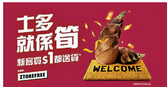
▲受惠去年收購「士多」，上半年來自電商收入同比急升26倍。