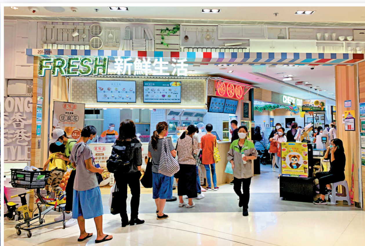
▲客源以中產居民為主的日出康城超市「FRESH新鮮生活」，今年盜竊案激增，被捕者多為主婦和退休人士。