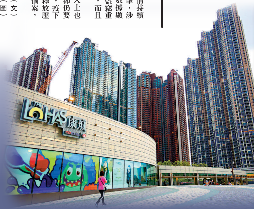
▲日出康城一帶住宅全屬私人屋苑，疫下竊案激增。