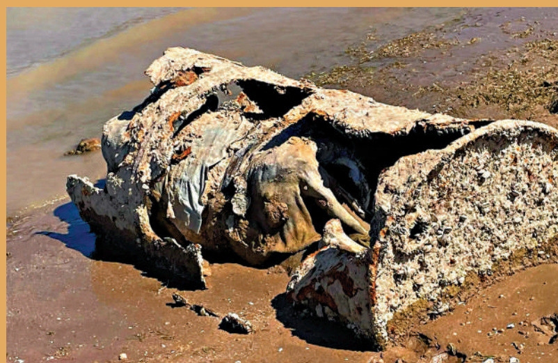
▲米德湖底出現裝着人骨的油桶，懷疑是美國黑幫所為。