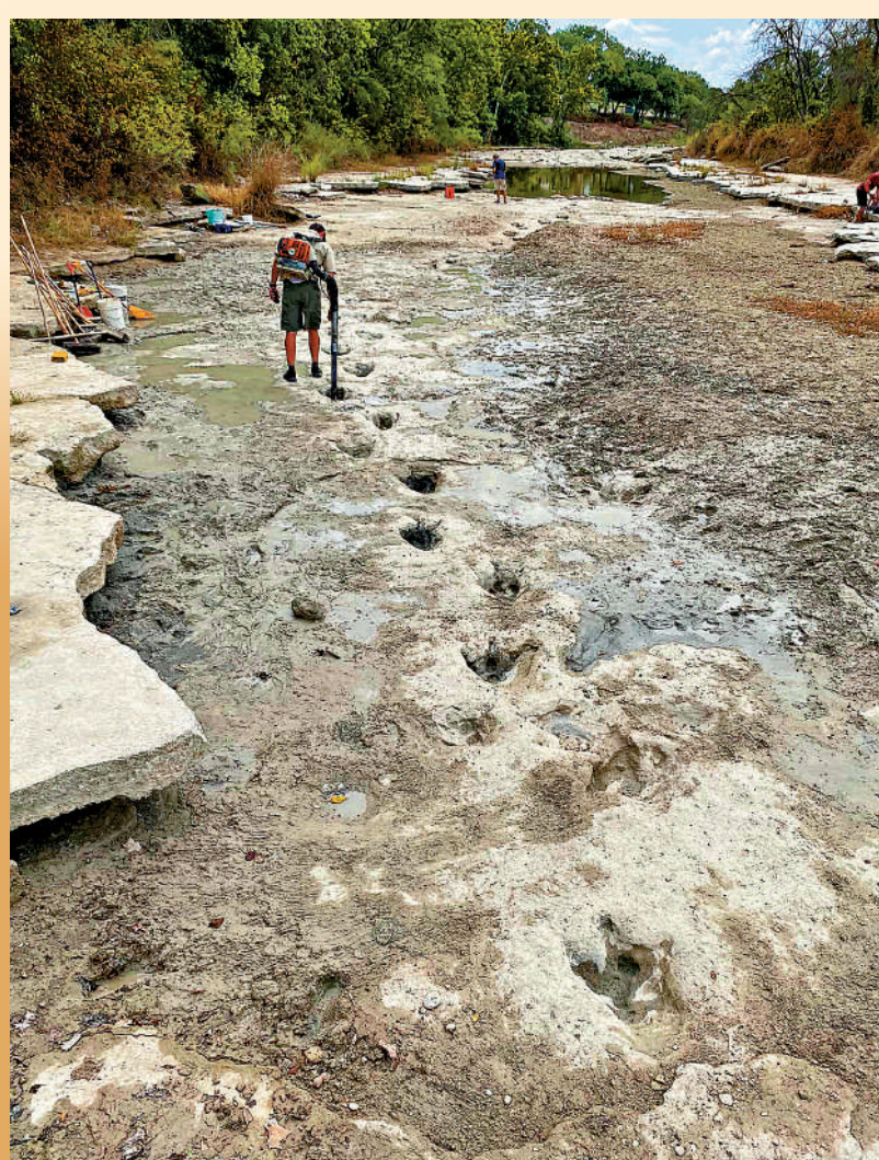
▲得州河流乾涸，當地公園出現1.13億年前的恐龍足跡。