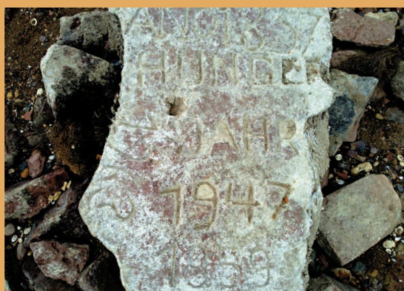
▲歐洲多條河流近期出現「飢餓石」，意味着水位達到歷史新低。

受長期乾旱影響，位於美國內華達州與亞利桑那州交界的米德湖水位下降，目前至少發現五具屍體，其中一具藏在油桶中。米德湖距離黑幫盤踞的「賭城」拉斯維加斯只有30分鐘車程，鐵桶藏屍也是黑幫的常用手法，接連發現的屍體可能都是黑幫犯罪的受害人。