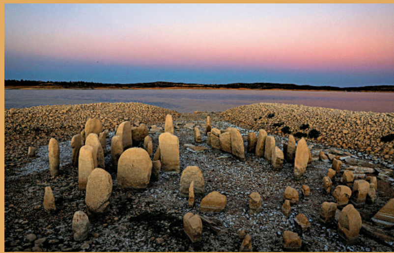
▲西班牙一處水庫乾涸，露出史前時代造就的巨石陣。