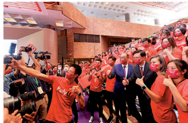
▲行政長官、理大校監李家超，在揭幕儀式後，與一班理大學生開心拍照。