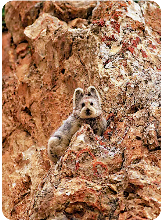
▲趴在裸岩上的伊犁鼠兔。

這樣一個只有20多厘米長的小動物還和全球氣候變化相關聯。從20世紀開始，受氣候變化的影響，許多動物向高海拔區域遷移。伊犁鼠兔首當其衝，成為反映氣候變化的晴雨表。隨著全球氣候變暖，天山的冰川退縮，雪線上升。喜歡寒冷的伊犁鼠兔逐漸退到天山高海拔的裸岩山峰上，這種環境改變對其生存極為不利，其數量自最初發現時的約3000隻，下降到目前的不足1000隻。近年，伊犁鼠兔的保護工作越來越受重視。隨著天山1號冰川保護區域中華伊犁鼠兔保護地和精河縣伊犁鼠兔保護地的先後建立，牠們最後的棲息地被保護下來。