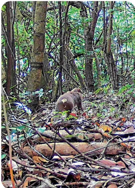
▲廣東粵北華南虎自然保護區通過紅外相機首次拍攝到藏酋猴。