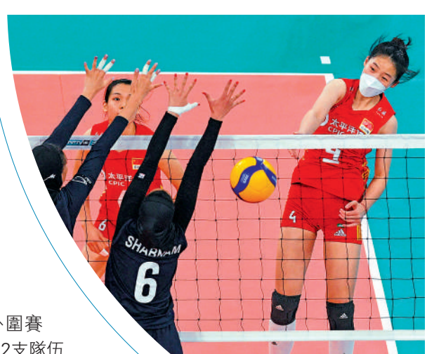
▲中國女排球員(右)戴口罩參賽，引發熱議。

【大公報訊】據中新社報道：中國排球協會26日就中國女排佩戴口罩參加亞洲盃一事致歉。中國排協表示，因工作不夠細緻給社會公眾帶來困擾誠懇道歉。 在25日進行的女排亞洲盃比賽中，中國女排對陣伊朗。當天比賽首局，中國女排球員佩戴口罩出現，在賽場，並打完首局比賽，中國隊首局以24：26失利。隨後中國隊球員摘下口罩，以25：19、25：10、25：13連扳3局逆轉獲勝。 參賽隊有運動員感染 中國女排戴口罩參加比賽引發熱議。中國排協26日發布公告回應稱，比賽之前，隊伍了解到參賽隊伍中已有運動員感染情況，且中國隊個別運動員也出現症狀，為了防範疫情傳播風險，隊伍從保護運動員健康出發，要求運動員進入比賽場館時要統一佩戴口罩。 中國排協還表示，因組委會未對運動員上場比賽是否佩戴口罩做出明確規定，運動員為了保護自己，比賽開始後佩戴口罩上場比賽。「由於我們臨場經驗不足， 沒及時提醒上場運動員摘掉口罩，因此第一局我們運動員均佩戴口罩上場比賽。第一局後半程，意識到戴口罩打球對運動員健康不利後，隊伍及時進行了提醒，我們運動員摘掉口罩完成了後面的比賽。」 中國排協還稱，今後將認真總結經驗教訓，統籌好疫情防控和比賽、訓練，在保護好運動員健康的前提下，打好每一場比賽，回報社會公眾的關心。 中國隊將在29日對陣巴林。