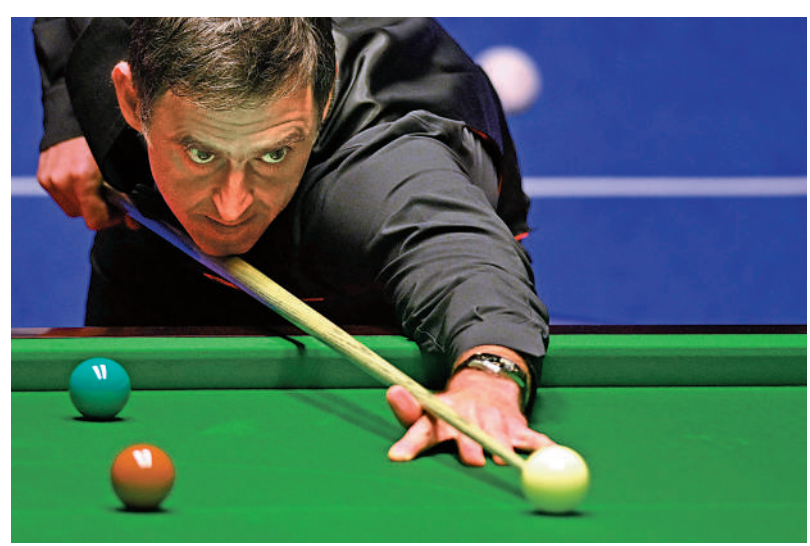
▲奧蘇利雲是7屆世錦賽冠軍。