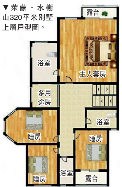
▼萊蒙·水樹山320平米別墅上層戶型圖。