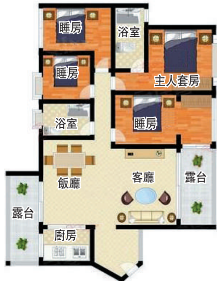
▲鴻榮源·熙園山院155平米四房兩廳戶型圖。