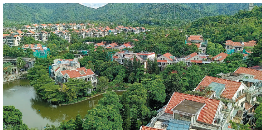
▲聖莫麗斯共分三期發展, 綠化率高, 望山向湖, 風景秀麗。