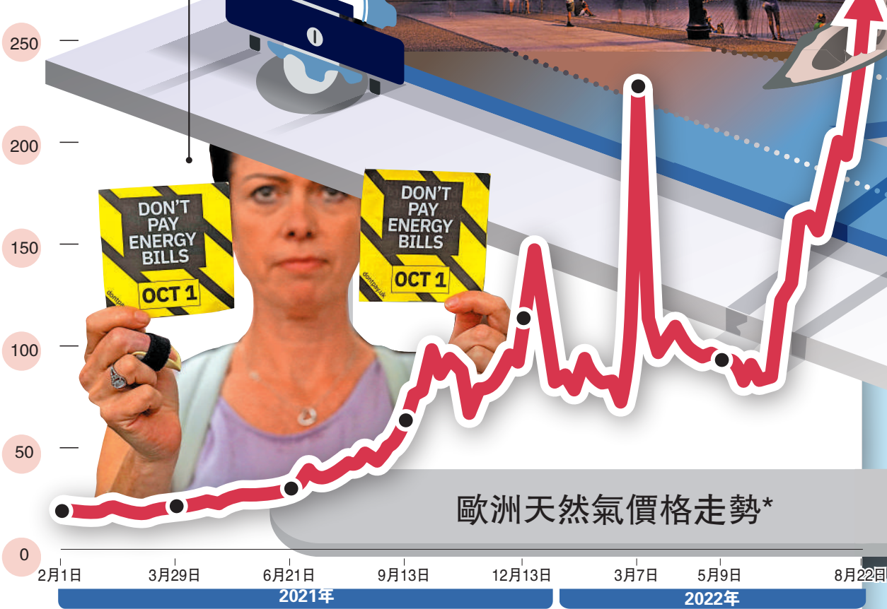
歐洲天然氣價格走勢*