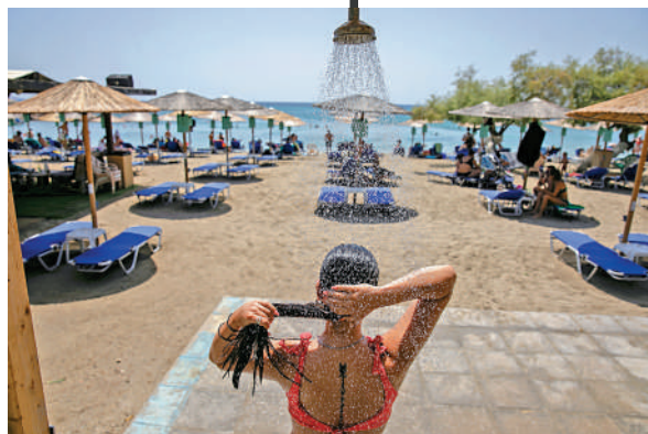
▲能源價格高企，歐洲人洗澡都成為了問題，圖為民眾在海灘淋浴。

德國政客們洗澡的招數更是五花八門。6月，德國副總理兼經濟和氣候保護部長哈貝克呼籲民眾淋浴時要「少洗快洗」，「不要超過五分鐘」。巴登-符騰堡州長克雷斯奇曼則建議民眾用濕毛巾擦身代替淋浴，並強調「這個有益的創舉」，更可以杜絕「頻繁洗澡」。