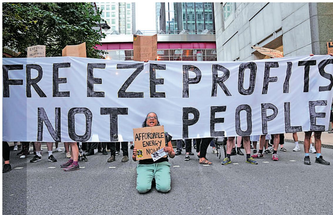
◀英國民眾26日包圍倫敦的天然氣和電力市場管理局總部示威，抗議能源價格上限升高八成。