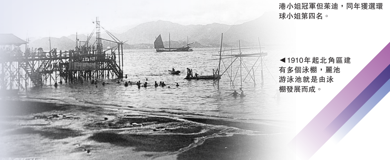
◀1910年起北角區建有多個泳棚，麗池游泳池就是由泳棚發展而成。