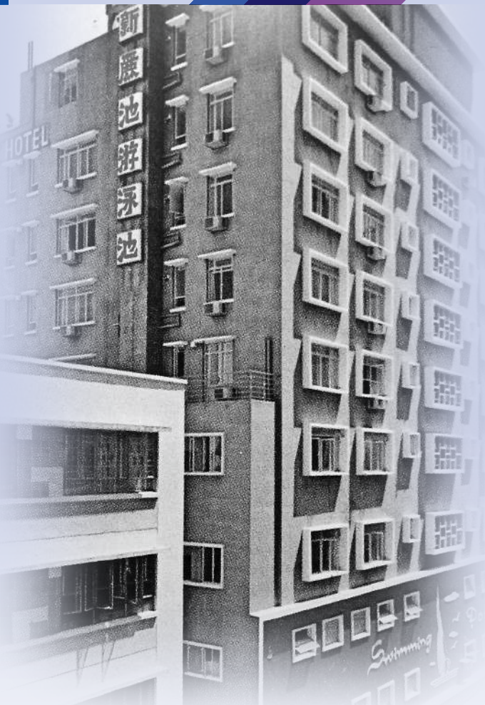
▲1960年的麗池易名「新麗池游泳池」，是一座十層高的綜合娛樂場所。