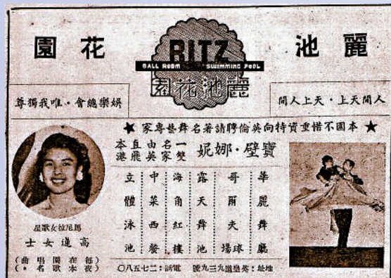
▲當年麗池花園小廣告。