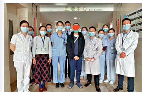
▲有香港患者亦受惠「港澳藥械通」，在粵獲治。

5 已批准內地臨床急需進口港澳藥品20個（共35批次）、醫療器械12個（共14批次），共惠及1054人次。