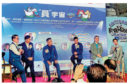
▲「員宇宙」輕年引力對話空間暨天河·灣區雙創基地27日在七客創悅灣正式揭牌。