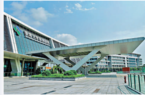
▲香港大學深圳醫院是「港澳藥械通」指定醫療機構之一。

2 指定醫療機構申報本機構已獲批准的藥品醫療器械承諾審批時限僅為1個工作日；指定醫療機構申報已納入目錄的藥品、醫療器械承諾審批時限分別為10個、15個工作日；較首次申報審批時限而言，平均縮短時限達56%。