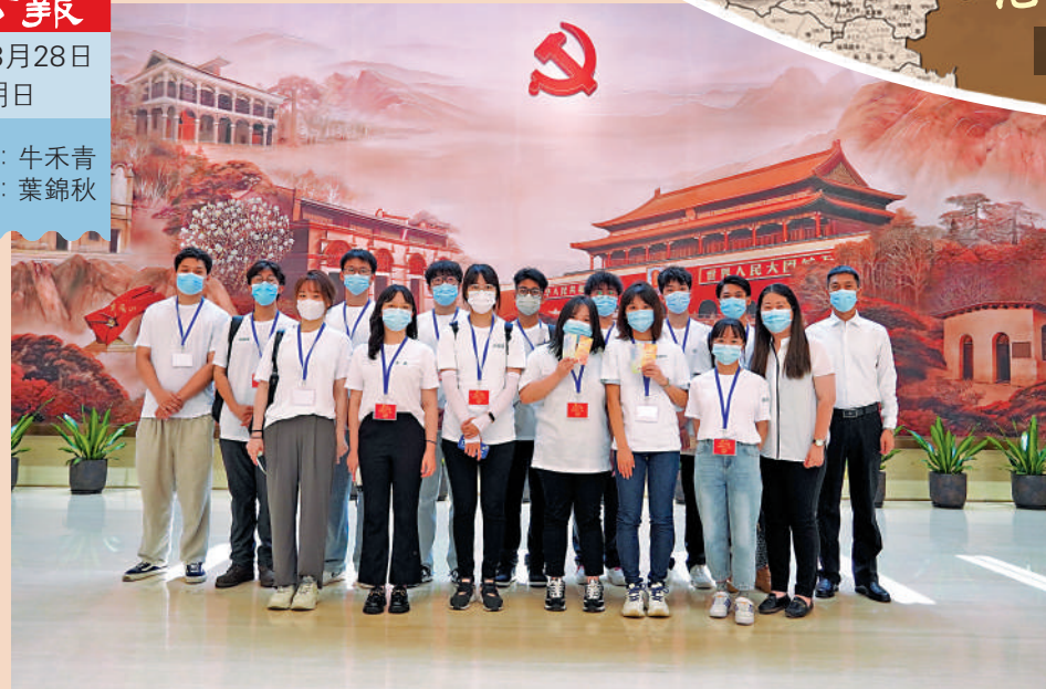
▲同學們在一大紀念館巨型瓷版畫《日出東方——從石庫門到天安門》前留影。