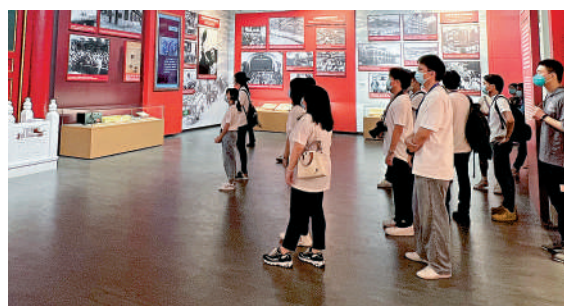
▲修復後的開國大典影像資料吸引觀眾駐足。