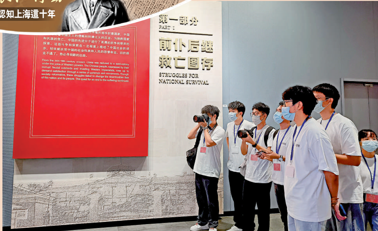
▶「范長江行動」香港傳媒學子走進一大紀念館。