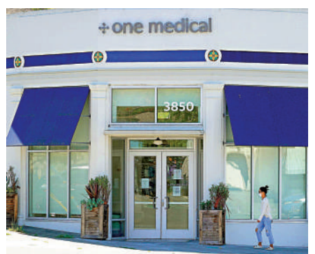
▲亞馬遜進軍醫療界頻受創，圖為剛被亞馬遜收購的診所。

亞馬遜多年來一直想打入醫療服務業，該公司 7 月宣布斥資 39 億美元收購會員制保健機構 One Medical，後者在美國 25 個市場有 188 家診所及 76.7 萬名會員，提供虛擬及實體護理服務。亞馬遜 2008 年買下郵購藥店 Pillpack，2018 年又與摩根大通及投資公司巴郡合資創立一個健康護理企業，僅三年後就黯然解散。