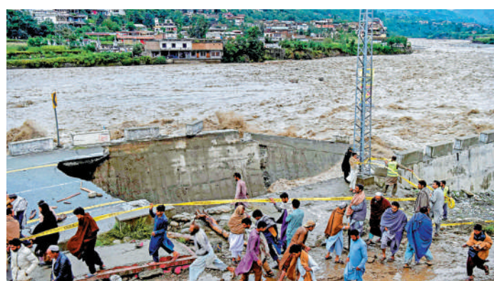
▲巴基斯坦洪災造成逾千人死亡，道路被沖垮。

扎爾達里周日進一步呼籲國際組織提供金融援助，並表示將要求聯合國成員國協助救災。他表示，洪災摧毀了巴基斯坦人民賴以生存的農作物，將對整體經濟形勢產生進一步打擊，可能會造成高達 40 億美元的損失。