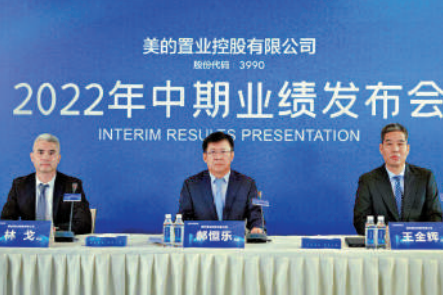
▲美的置業強調，不會大規模減價拋售。

新希望服務上半年錄得股東應佔溢利9988.6萬元，較去年同期增長70%；每股基本盈利0.12元，不派發中期股息。