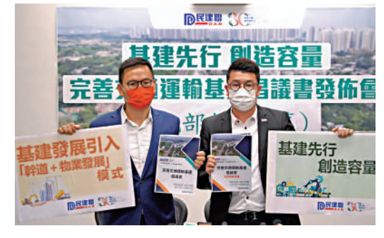
▲民建聯發布完善交通運輸基建倡議書(北部都會區篇)，包括五大範疇十項倡議。

倡議書提出的五大範疇分別為：「配合新發展區 興建新主道幹線」、「完善鐵路網絡 加強新界區域連繫」、「基建發展引入「幹道+物業發展」模式」、「多元營運方案 為新發展區提供交通服務」、「引入新集體運輸系統配合環保綠色公共交通發展」。