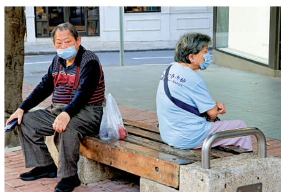
▲普通及高額長者生活津貼將在9月1日落實合併，劃一採用普通津貼較寬鬆資產上限，每月發放3915元。

【大公報訊】政府將於9月1日落實合併普通及高額長者生活津貼，約五萬名長者受惠，每月能多領995元。現正領取每月2920元普通津貼的長者毋須提交申請，將自動獲發高額津貼。