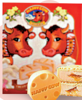
HAPPY COW 起司流心月餅禮盒