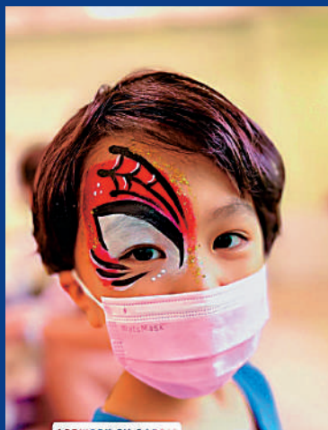
▲小朋友面上的彩繪圖案，亮麗可愛。

口味方面，除經典的流心奶皇月及流心朱古力口味，品牌更推出全新低糖伯爵茶純素口味。