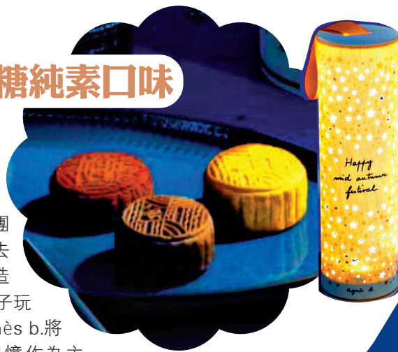
agnès b. 環保月餅禮盒

中秋節是團聚的節日，過去人們會把柚皮造成燈籠給小孩子玩耍。今年，agnès b.將愉快的團圓回憶作為主題，以傳統柚皮燈籠為設計靈感，推出環保月餅禮盒。