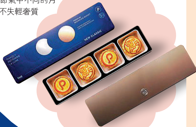
Pinkoi x 望月 限量聯乘禮盒 The New Classic

內有四件「流心奶黃月餅」及「經典奶黃月餅」的禮盒，以Pinkoi Navy配以金銅色細節點綴，輔以簡約幾何線條勾畫出新月、映月等中秋節氣中不同的月亮姿態，簡約而不失輕奢質感。