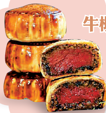
PHOEBE'S KITCHEN 威靈頓月餅—牛柳/三文魚

以威靈頓牛柳製成的月餅，你吃過嗎？由本地學生Phoebe研製、全港首創的威靈頓月餅，2021年在網絡受到好評，並於今年推出市場，成為令人眼前一亮的另類月餅。