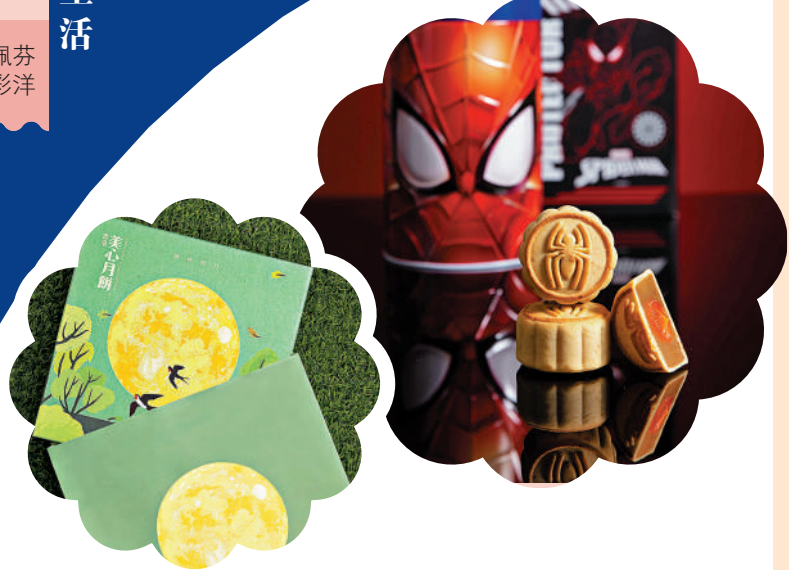
美心月餅 翠林明月雙黃白蓮蓉月餅禮盒