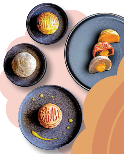
開墾 流心三部曲望月禮盒

品牌配以三款特色吃法：冰鎮、常溫及氣炸加熱。大家可感受月餅外酥內軟，奶黃內餡濃郁滿溢，色香味俱全。