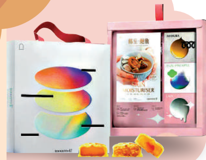
moonwell 自選燉湯食療尊貴月餅禮盒