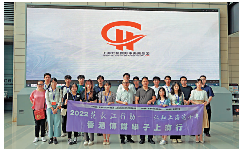
香港傳媒學子走進虹橋國際中央商務區。