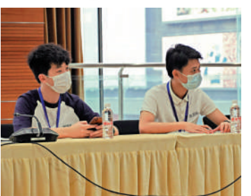
港生諮詢港人創業優惠政策。

者了解，這朵花被譽為牡丹之王，在顏色為獨特的魏紫色以外，花朵的前景被些許葉子遮擋，花的位置處於中央但又不是絕對的中心，這或許也映射中國的中庸之道。講解員還給眾傳媒學子分享了一個故事，當初有一隻蝴蝶附著畫中的花上，可見畫作的栩栩如生。