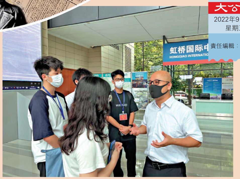
港生參觀進博會展館內藝術作品。