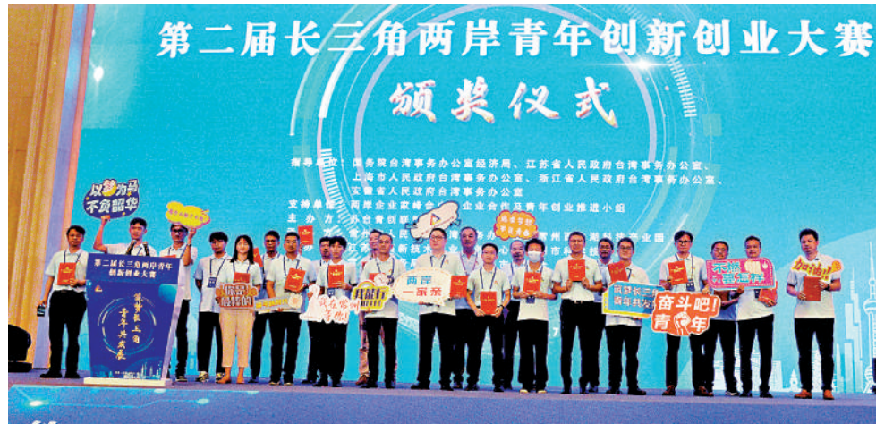
▲7月29日,第二屆長三角兩岸青年創新創業大賽頒獎儀式在常州舉行。