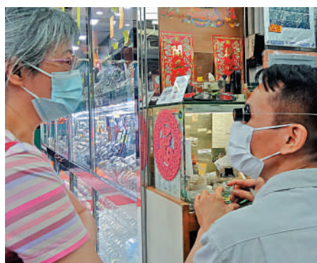
▲市民逛錶行多只看不買，其中一名顧客到儉德錶行光顧換電池。

太子鐘錶老闆鄧鉅今年5月曾對傳媒慨嘆，疫情下自由行政板塊消失，即使通關後市況好轉，亦難再重返昔日的超級旺市，奢侈品消費的黃金期已一去不返，現在同行們整天都在發夢，希望通關、通關再通關。