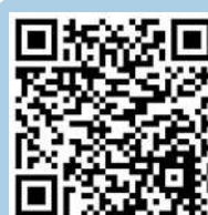
港區人大選舉會議成員名單