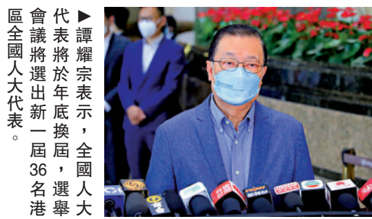
譚耀宗表示，全國人大代表將於年底換屆，選舉會議將選出新一屆36名港區全國人大代表。