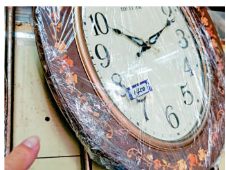
▲廣生表行1989年遭悍匪搶劫，櫃位後的彈孔遺留至今。