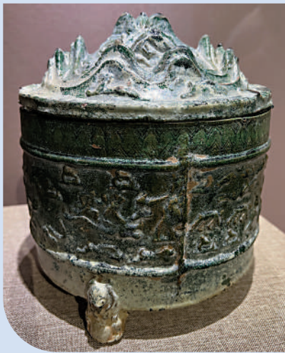
▲東漢綠釉獵虎樽，反映了古代獵虎的場面。