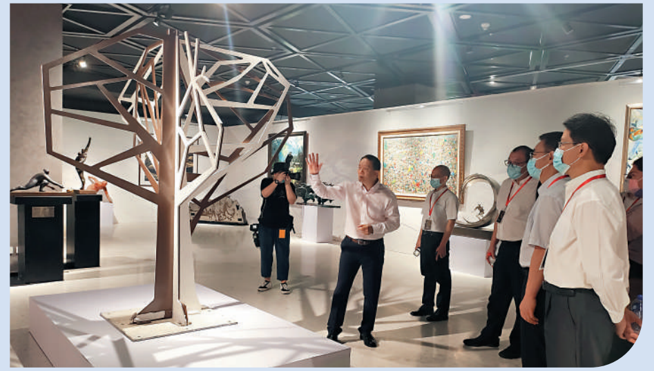
▲觀眾參觀「橄欖樹」雕塑。