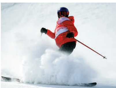
▲谷愛凌是北京冬奧冠軍。