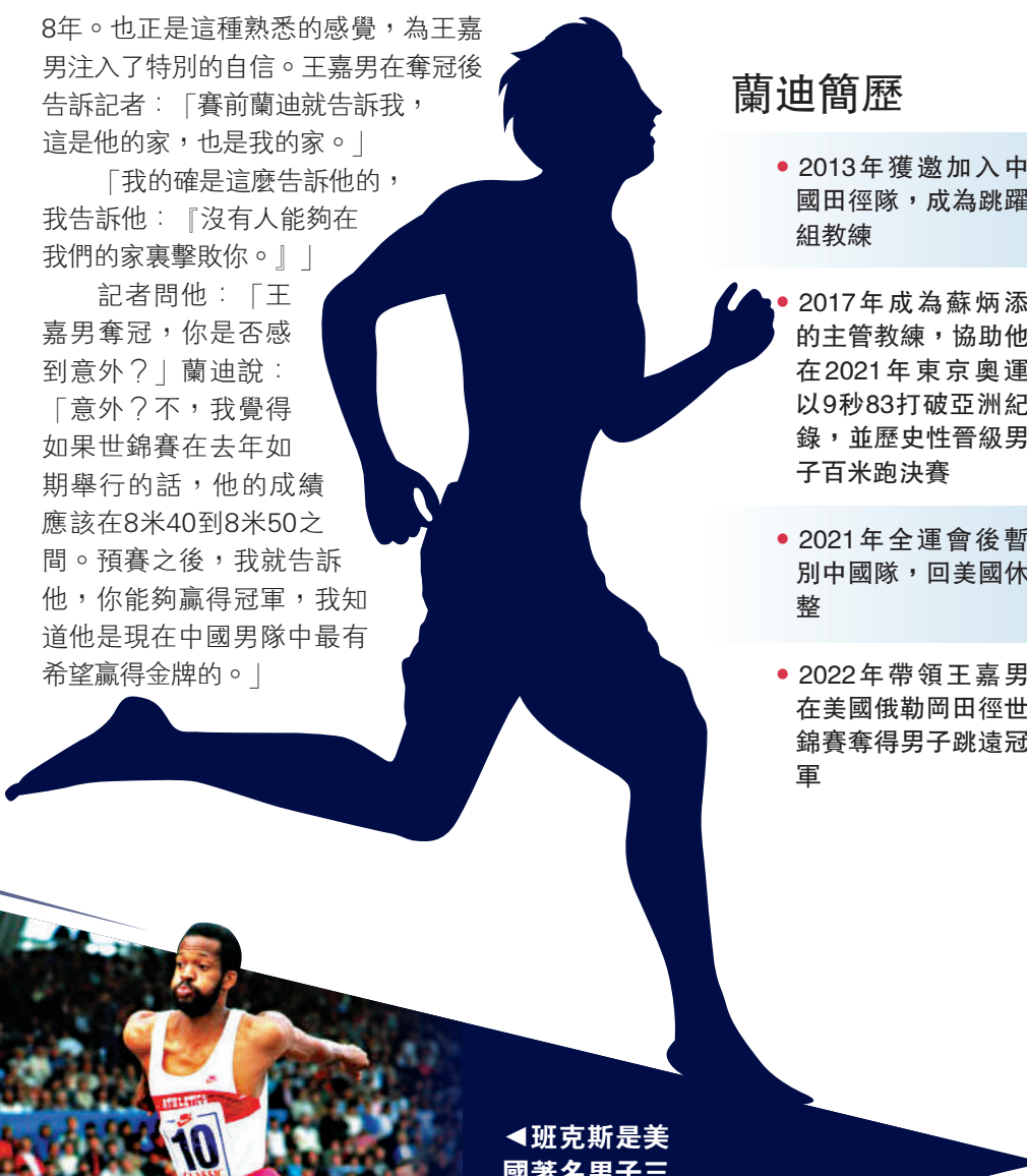
◀班克斯是美國著名男子三級跳名宿。