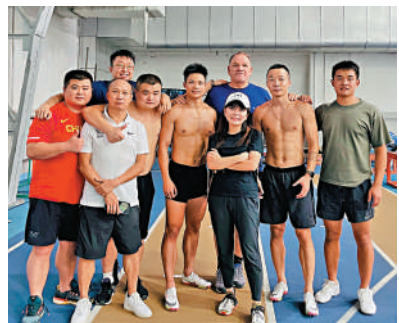
▲中國田徑隊在蘭迪(後排右三)的執教下，成績顯著提升。

中國運動員做教練。他現在最重要的目標，是幫助女子800米運動員王春雨備戰巴黎奧運會。