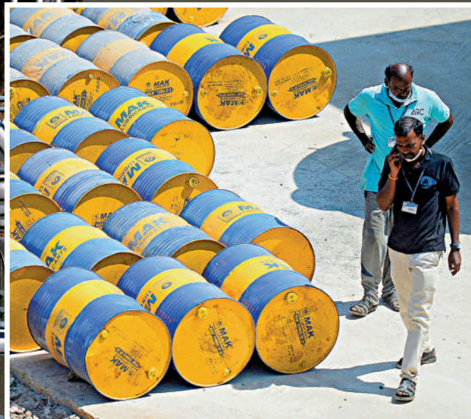
◀「北溪-1」號是俄羅斯向歐洲輸送天然氣最主要的管道。▲印度一間油廠內堆滿了油桶。