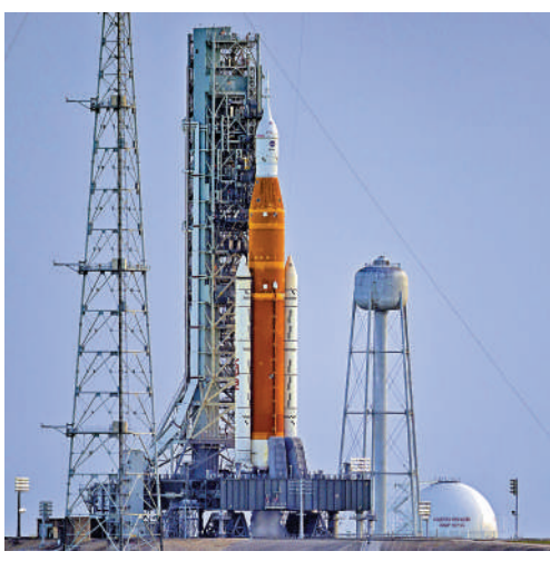
▲美登月火箭3日檢測出故障，再度推遲發射。

洩漏現象仍然存在。NASA約在發射前三小時再度取消發射。專家表示，氬氣是一種強大的火箭燃料，但作為最小的分子，它很難操作，會從最小的縫隙中洩漏。《紐時》稱，3日的取消發射也許不是最後一次，下次發射日期可能是在5日或6日。但如果在短時間內不能解決液氫燃料洩漏等問題，可能就要等到9月下旬或10月才會發射。