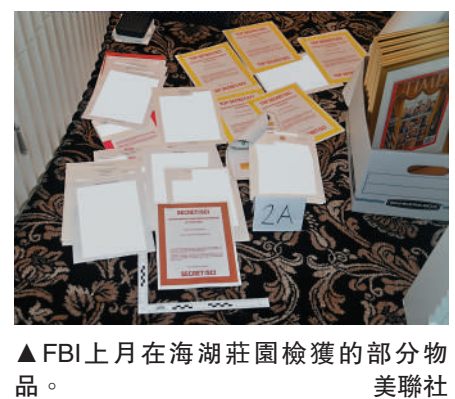
▲FBI上月在海湖莊園檢獲的部分物品。

【大公報訊】據《華爾街日報》報道：根據2日解封的法庭紀錄，美國聯邦調查局（FBI）8月8日搜查前總統特朗普位於佛州的海湖莊園時，發現不少政府涉密文件與特朗普其他的私人物品混在一起，其中還包括數十個標記為「涉密」的空文件夾。FBI上月8日從海湖莊園帶回超過13000份物品，分為33箱，其中7箱物品來自特朗普的辦公室，其餘物品來自特朗普私人俱樂部的儲藏室。在這些文件中，有103份各類涉密文件，有90個空文件夾，其中48個帶有「涉密文件」標記，還有11179份非涉密政府文件，1673份媒體剪報及52份書籍、衣物或禮物。有情報官員擔憂，數十個標記為