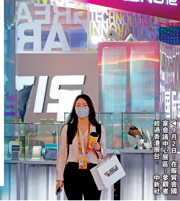
9月2日，在服貿會國家會議中心展區，參觀者經過香港展區。

▲連日來，服貿會「香港館」已經組織多位業界代表及專家，就綠色金融、創新科技、京港合作等領域的發展機遇等話題進行深入交流。圖為「香港館」研討會現場。