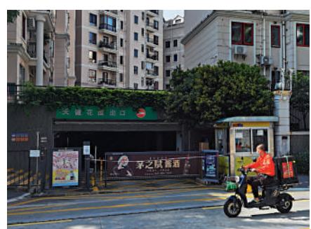
▲深圳福田社區封閉式管理，停車場出入口拉起封條。

考試的人員，憑社區證明可外出；持護照機票需要出國的居民，憑護照機票和24小時核酸即可成行。