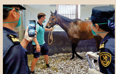
▲海關對粵港跨境賽馬進行監管。