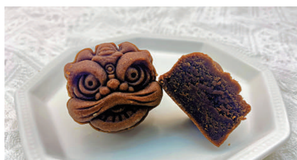
▲設計成舞獅造型的小眾月餅。

粵港澳大灣區首個「口岸服務標準化」體系近日正式落地，港珠澳大橋珠海口岸也成為首個實施「大灣區口岸服務標準化」的口岸。港珠澳大橋珠海口岸還創新性地將5G與口岸通關服務結合。通過AI分析，為公眾的通關與出行提供參考。