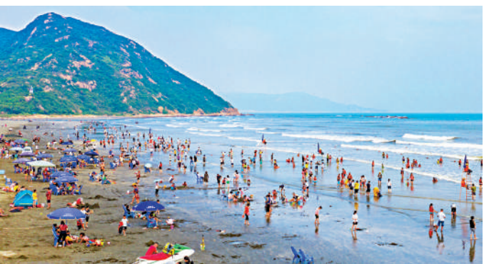
▲台山市赤溪鎮銅鼓黑沙灣旅遊度假中心。