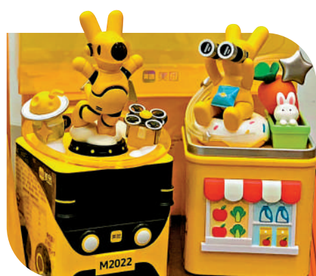
▲美觀與實用性兼具的月餅禮盒。