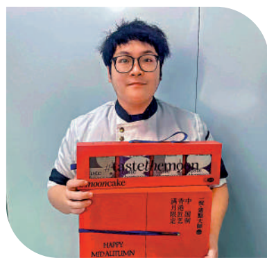
►在深圳創業港青團隊為客戶推出中秋節定製月餅。

幾年時間裏，曾經風靡一時的螺螄粉、韭菜、小龍蝦等獵奇口味的月餅如今漸漸淡出大眾視野。而經時間考驗留下來，依然是這些最傳統的味道。月餅口味回歸，中秋節的氛圍更濃了。