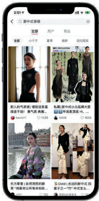
▲許多時尚達人在社交媒體上發布「新中式穿搭」網絡圖片。