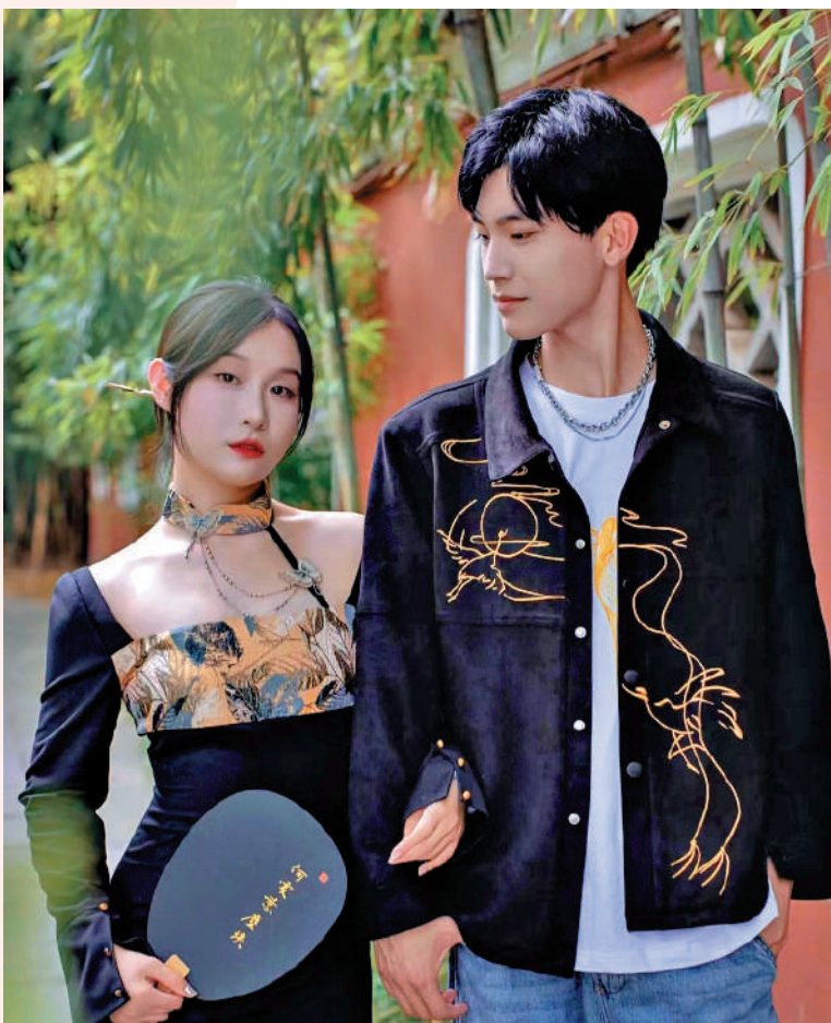
▲「新中式穿搭」情侶系列在社交媒體上受關注。

經典： 也稱為盤紐，或紐結、紐半祥，是傳統中式風格的經典紐扣，用來固定衣襟或裝飾